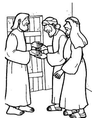
La sera di Pasqua Gesù appare agli apostoli